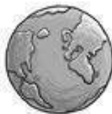
En klode designet for liv...